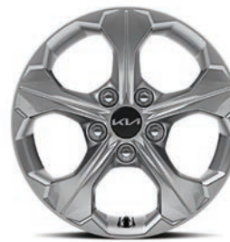
16" 205/65R17 Rin de aluminio EX