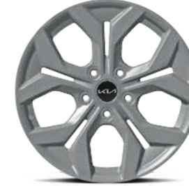
17" 215/60R17 Rin de aluminio EX PACK, SX