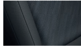
Negro, un tono EX