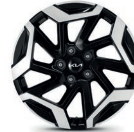
17" 215/60R17 Rin de aluminio SXL