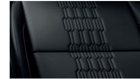
Negro, un tono EX PACK, SX, SXL